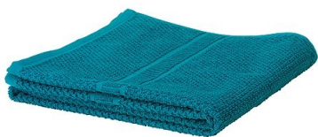
MATERIAL D'HIGIENE PERSONAL. (tovallola i sabó)