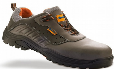
SABATES DE PROTECCIÓ