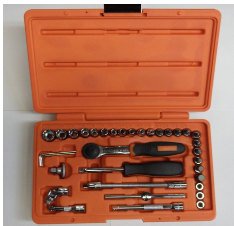
1-CAIXA CARRACA PETITA 1/4"