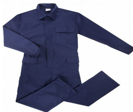
"MONO" DE MECÀNIC de color blau marí amb el logo de l'institut brodat. El podeu trobar a: Al-Sol Vestuari Laboral