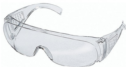
ULLERES DE PROTECCIÓ INDIVIDUAL