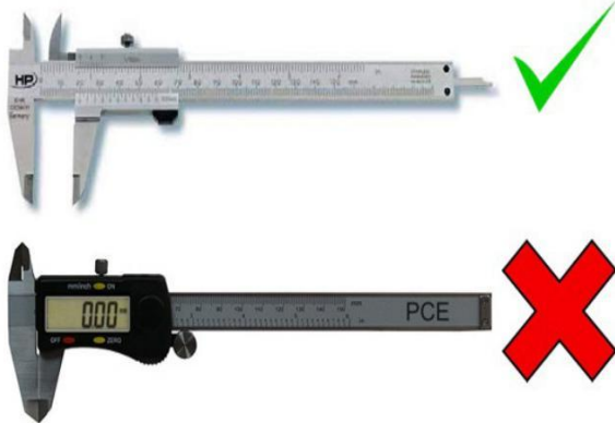
1- PEU DE REI (metàl·lic, no plàstic)