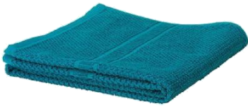
MATERIAL D'HIGIENE PERSONAL. (tovallola i sabó)