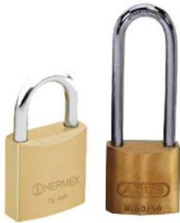
2- CANDAUS (per les caixes d'eines) 1 arc llarg i 1 arc curt