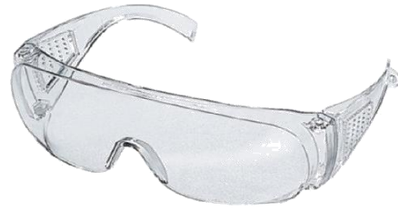
ULLERES DE PROTECCIÓ INDIVIDUAL