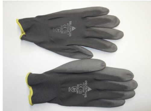
1- JOC DE GUANTS DE TREBALL MECÀNIC