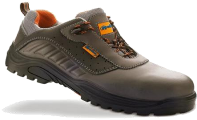
SABATES DE PROTECCIÓ