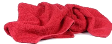
DRAPS (PER TREBALLS DE TALLER)