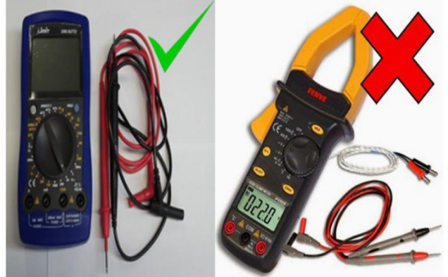
1- TÈSTER ELÈCTRIC